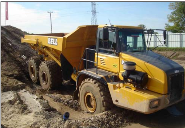
En el sector de dúmperes articulados está presente Bell. La transmisión automática aporta la durabilidad y eficiencia requerida por aplicaciones para canteras, minas y zonas de construcción donde se dan las condiciones de trabajo más duras.

Allison Transmission líder mundial en la fabricación de cajas de cambio automáticas para usos industriales debutará en SMOPYC, la principal feria nacional de maquinaria y obras públicas, con el anuncio de 2 importantes nuevas homologaciones con fabricantes de camiones. Además, los visitantes podrán conocer en el stand G-H/1-6 de Allison, la transmisión de la Serie 4000. Un equipo de ingenieros de Allison estará a disposición de los interesados para informar sobre las aplicaciones que ofrece la compañía para cumplir con las necesidades y requerimientos del sector.