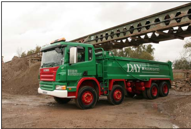
Buen ejemplo de la creciente presencia de Allison en el sector de la construcción es este dúmper rígido de Scania operado por la empresa Day Aggregates en el Reino Unido.

Allison dará a conocer nuevos contratos con fabricantes de vehículos durante la feria y presentará sus últimos modelos de transmisiones en SMOPYC los próximos 22 a 26 de Abril.