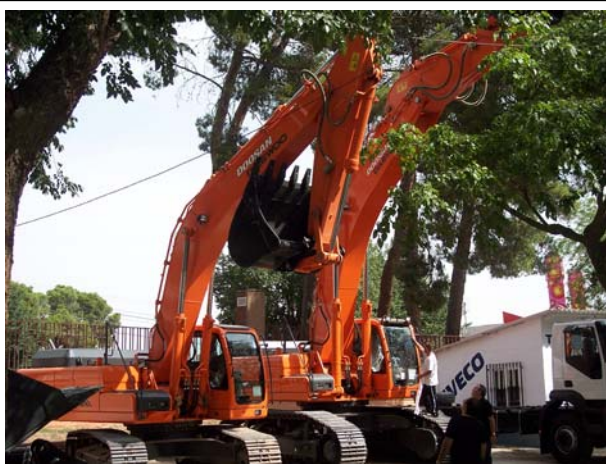
Excavadoras Doosan Daewoo DX340LC y DX520LC en el stand de Autopalas Arganda.

La nueva excavadora hidráulica DX340LC sobre cadenas cuenta con más ventajas que su antecesora, la Solar 340LC. Con un peso operativo de 34 toneladas y un