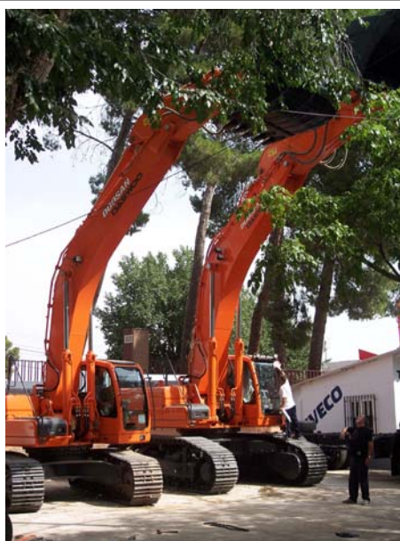
Excavadoras Doosan Daewoo DX340LC y DX520LC en el stand de Autopalas Arganda.

Uno de los aspectos más visibles de esta nueva gama son las mejoras en la ergonomía: basta mirar las nuevas excavadoras donde notamos que el confort del operador ha sido prioritario en los objetivos de diseño de las nuevas máquinas. La cabina posee una amplia superficie en vidrio —incluyendo techo solar—, lo que garantiza una mejor visibilidad en toda el área de trabajo. Los niveles de ruido, inferiores a los 73 dB, son actualmente comparables a los que se sien-