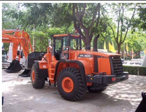
Cargadora Doosan Daewoo DL 400 en el stand de Autopalas Arganda.

De entre los productos presentados (que incluían una mini cargadora 430, dos mini excavadoras 55, y las excavadoras 180 y 210 de la gama Solar) destacamos los modelos DX340LC y DX520LC, dos novedades en la nueva gama de excavadoras lanzada por la marca coreana al comienzo de 2006.