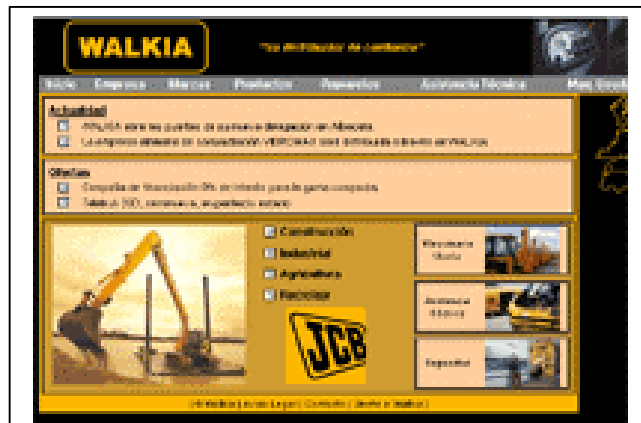
Detalle de la página inicial de walkia.es

Con su diseño innovador, acorde con la nueva imagen de WALKIA y una funcionalidad fuera de serie, walkia.es consigue cubrir totalmente las necesidades informativas de los compradores de maquinaria. Su amplia gama de equipos cubre ya el 95% de las necesidades del sector de maquinaria de construcción y obras públicas. Ahora, WALKIA entra en la red Internet para ofrecer soluciones amplias a las cuestiones relacionadas con la maquinaria.