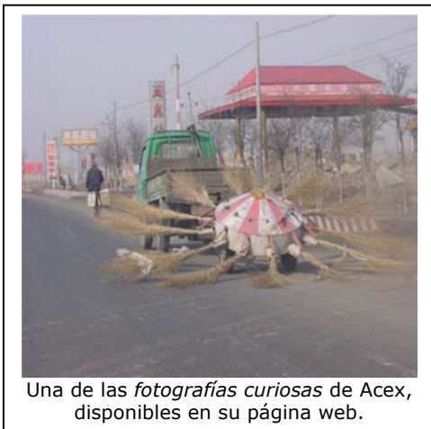
Una de las fotografías curiosas de Acex, disponibles en su página web.

Acex utiliza todos los medios a su alcance para la divulgación de sus actividades. La Asociación organiza regularmente jornadas técnicas sobre temas que afectan directamente al sector de la conservación. La última de ellas, celebrada en Valencia el pasado 22 de marzo, llevaba por título Indicadores en la gestión de la conservación de carreteras .