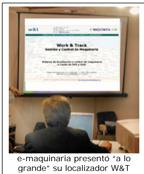
e-maquinaria presentó "a lo grande" su localizador W&T

Como complemento a la muestra de marcas y productos, Construent 03 ha supuesto el marco ideal para la creación de un foro de conocimiento, más que de discusión, de todos aquellos aspectos que rodean al sector del alquiler de maquinaria en nuestro país.