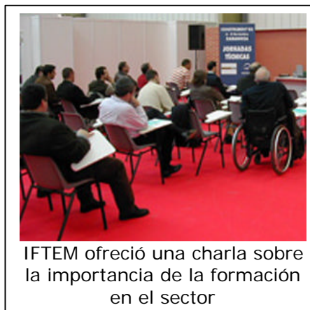
IFTEM ofreció una charla sobre la importancia de la formación en el sector

La seguridad estuvo también presente en todo momento durante la Feria. En la segunda jornada, los expertos en formación de operadores del Instituto de Formación en Técnicos de Mantenimiento (IFTEM) ofrecieron una interesante charla acerca de la prevención de riesgos en el alquiler de maquinaria, una cuestión para la que cada vez se demandan más soluciones. Los programas formativos de IFTEM , especialmente diseñados para