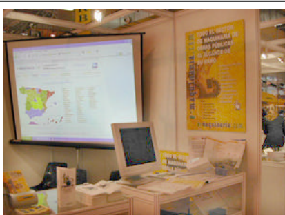
Detalle del stand de e-maquinaria en Construent 03

El primer encuentro de Alquiladores de Obras Públicas y Construcción, Construent 2003 se clausuró en la Feria de Zaragoza con un balance muy positivo, al convocar a más de 2.500 profesionales del mundo del alquiler, procedentes de todas las comunidades autónomas españolas e incluso de otros países como Alemania, Andorra, Italia y Portugal