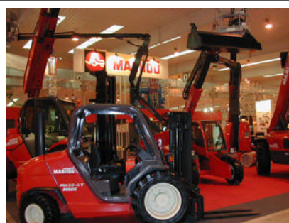
Manitou no quiso perderse el evento

Primeras firmas, importantes novedades, y todo un recorrido por los últimos desarrollos en equipamiento y servicios al profesional del alquiler han hecho de Construent 03 un punto de encuentro sin duda ineludible para el sector, además de servir como foro de reflexión para las numerosas cuestiones a las que este joven sector debe enfrentarse, desde el asociacionismo hasta la utilización de las nuevas tecnologías.